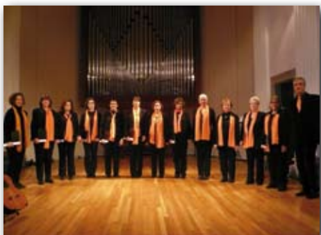
Cloenda de l'any Amades a Girona, 17 de gener de 2010