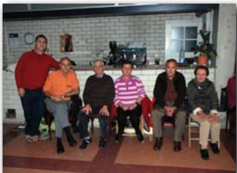
Sardanes de Montilivi, 7 de novembre de 2009