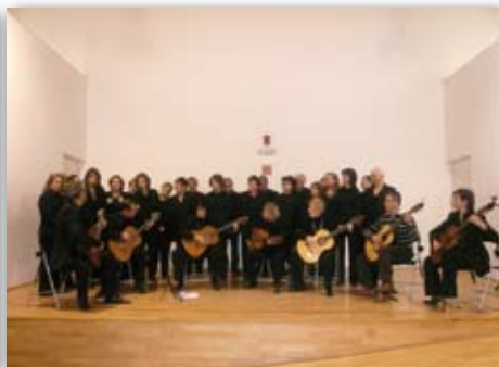
Intercanvi Coral a Manlleu, 13 de desembre de 2009