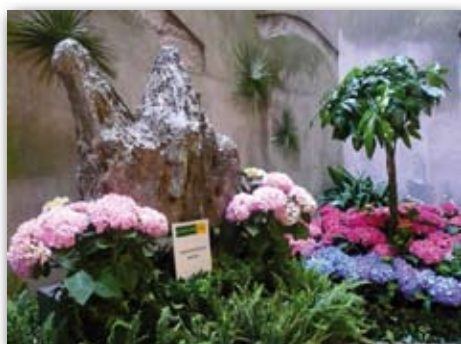
Museu d'Història, exposició de Flors, 8 de maig de 2009