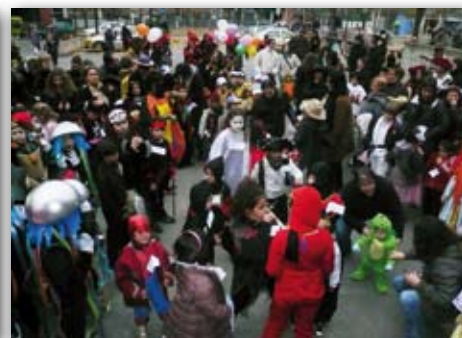
Carnaval de Montilivi, 13 de febrer de 2010