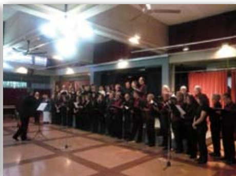
Trobada de Corals a Montilivi, 25 d'octubre de 2009