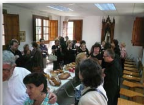
Monges Carmelites de Montilivi, 24 de maig de 2009