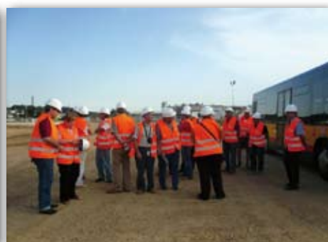
Visita de la FAV a les obres de l'AVE, 21 de juliol de 2009