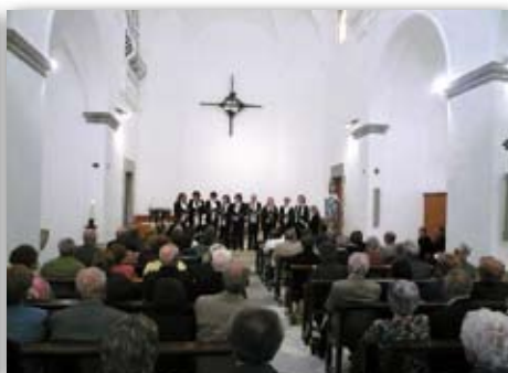
Festa de la Gent Gran de Medinyà, 17 de maig de 2009