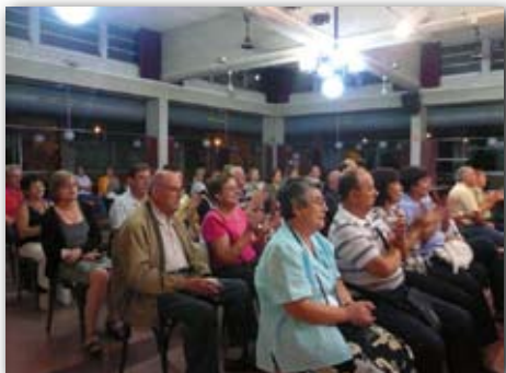
Cantada d'havaneres, 4 de setembre de 2009