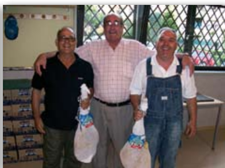
XVIII Hores de Petanca, 9 de maig de 2009