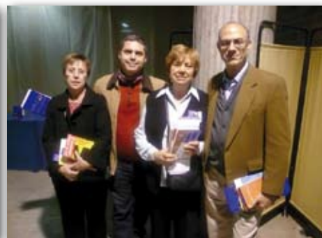
Nit del Voluntariat, 6 de novembre de 2009