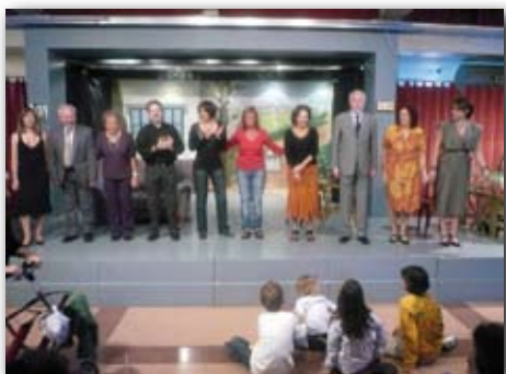
II Mostra de Teatre Amateur de Barri, 16 d'octubre de 2009