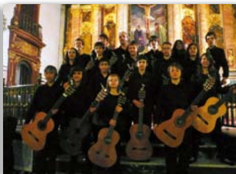
Actuació d'Acords Joves a Gandía, 5 de maig de 2009