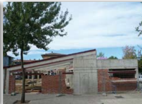
Obres Llar Infantil de Montilivi, 20 de setembre de 2009