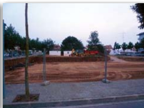
Obres de la Llar d'infants, 11 de maig de 2009