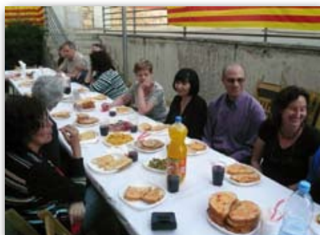
Festa de la Federació d'AAVV, 16 de maig de 2009