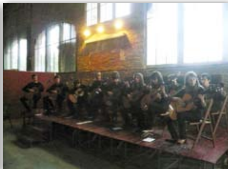
Acords Joves a Celrà, 19 de setembre de 2009