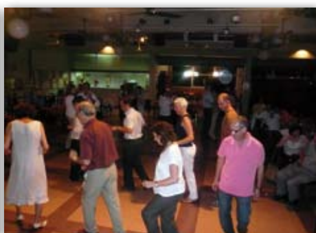
Comiat Activitats del Casal, 26 de juny de 2009