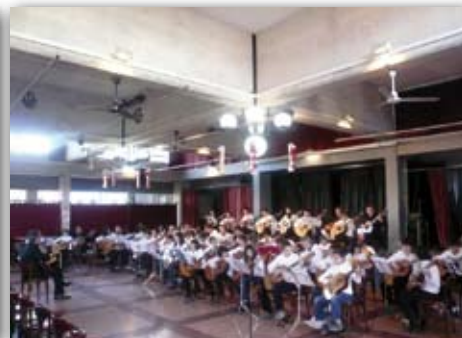
Concert de Nadal, 19 de desembre de 2009