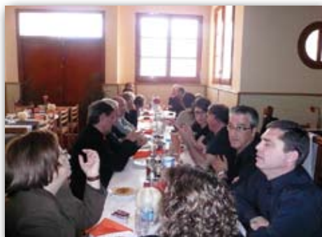
Diumenge de Rams, 5 d'abril de 2009