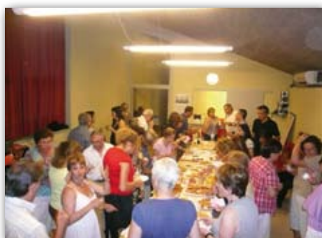
Comiat de les activitats, 18 de juny de 2009