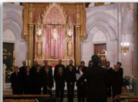
Actuació de la Coral Montilivi a Gandía, 5 de maig de 2009