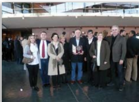
La FAV rep la placa de la Policia Municipal, 30 de gener de 2010